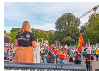
Viele Menschen zeigen Flagge gegen eine geplante AfD-Kundgebung.