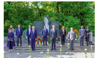
Gedenken zum 75. Jahrestag der Befreiung der Opfer des Nazi-Regimes.