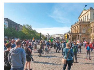
Trotz Corona: Bunt statt Braun gegen rechte Hetze