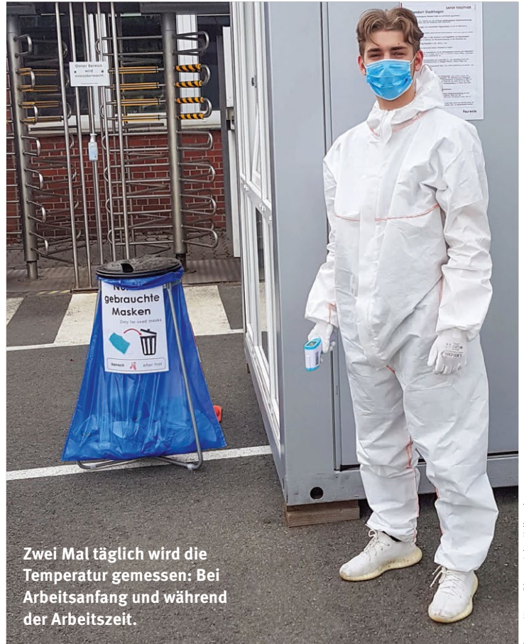
Zwei Mal täglich wird die Temperatur gemessen: Bei Arbeitsanfang und während der Arbeitszeit.

Die extreme Ausweitung stellt jetzt trotzdem eine große Herausforderung dar. »Wir haben sehr sensible Bereiche wie zum Beispiel den Datenaustausch mit unseren Kunden. Das geht nicht von zu Hause aus, weil wir dort nicht unsere hohen Sicherheitsstandards gewähr-