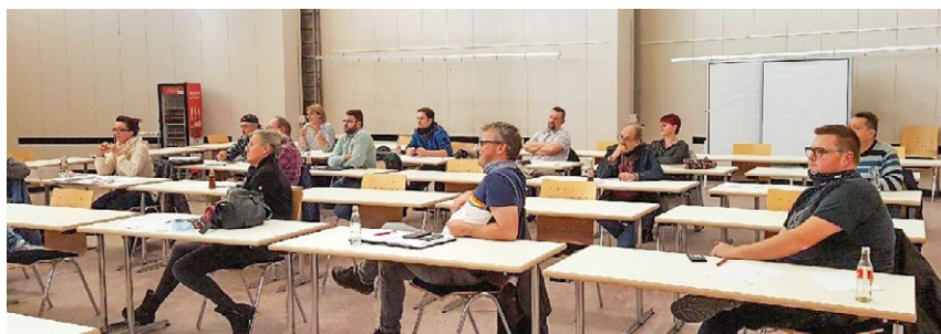
Die erste Sitzung des neu gewählten Vertrauensleute-Ausschusses fand als »Hybrid«-Veranstaltung statt: Mit Abstands- und Hygieneregulungen im Gewerkschaftshaus und mit zugeschalteten Teilnehmenden über Videoplattform.