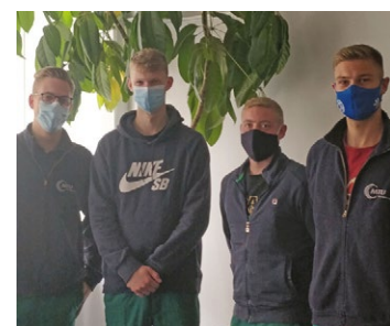
Jugendvertreter bei MTU