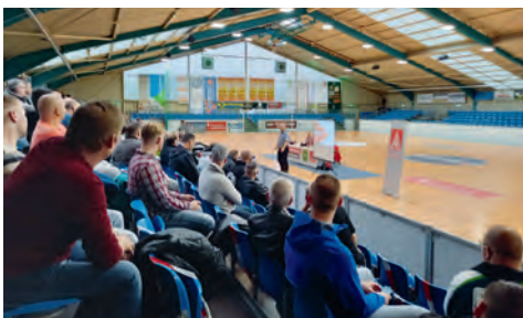
August 2020 (oben): Info-Stammtisch und Oktober 2020: Mitgliederversammlung in der nahe gelegenen Sporthalle