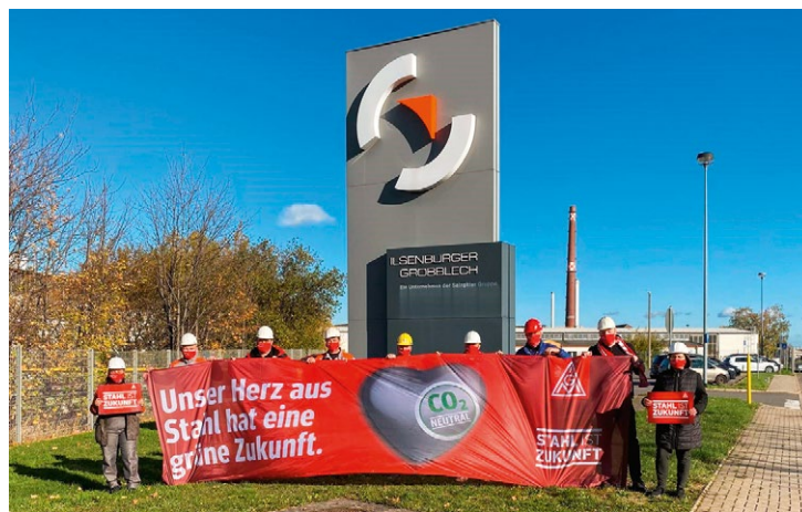
IG Metall-Vertrauensleute der Ilseburger Grobblech vor dem Betrieb

»Es geht in der Stahlindustrie um die Sicherung der Arbeitsplätze bei einer gleichzeitig ökologischeren Produktionsweise. Beides ist möglich! Es muss aber von der Regierung nicht nur gewollt, sondern auch finanziell unterstützt werden. Wir als IG Metall werden dieses Thema weiter