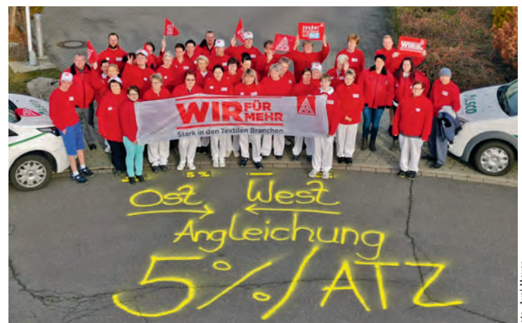
Tarifaktion bei AlSCO Berufsbekleidung in Merseburg am 13. Februar 2020