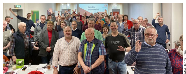
Abschlussfoto von der letzten Delegiertenversammlung am 11. März 2020. Dank und Anerkennung gilt allen Mitstreitern für ihr Engagement in den vergangenen vier Jahren!

Tarifkommission +++ Magna Powertrain in Roitzsch, FEV in Brehna und Heim & Haus in Osterfeld haben erstmalig eine Tarifkommission gewählt mit dem Ziel der Heranführung an den Flächentarifvertrag. +++