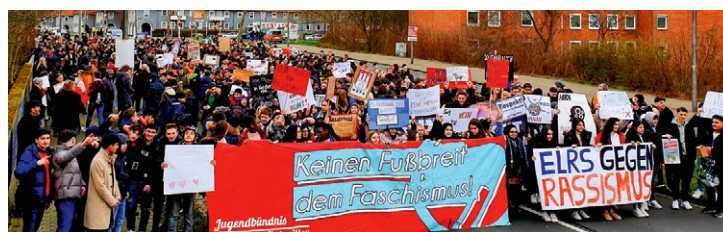
Jugendliche aus Salzgitter zeigten auch nach dem Terror in Hanau mit zehn Toten Flagge gegen Rassismus.

Im Rollenspiel »Wie im richtigen Leben« konnten Schülerinnen und Schüler sich damit auseinandersetzen, was es bedeutet, eine Behinderung zu haben, homosexuell oder geflüchtet zu sein. Mit Fragen