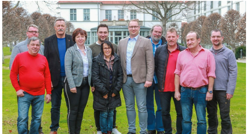
Gewählte Mitglieder des Ortsvorstands der IG Metall Halberstadt