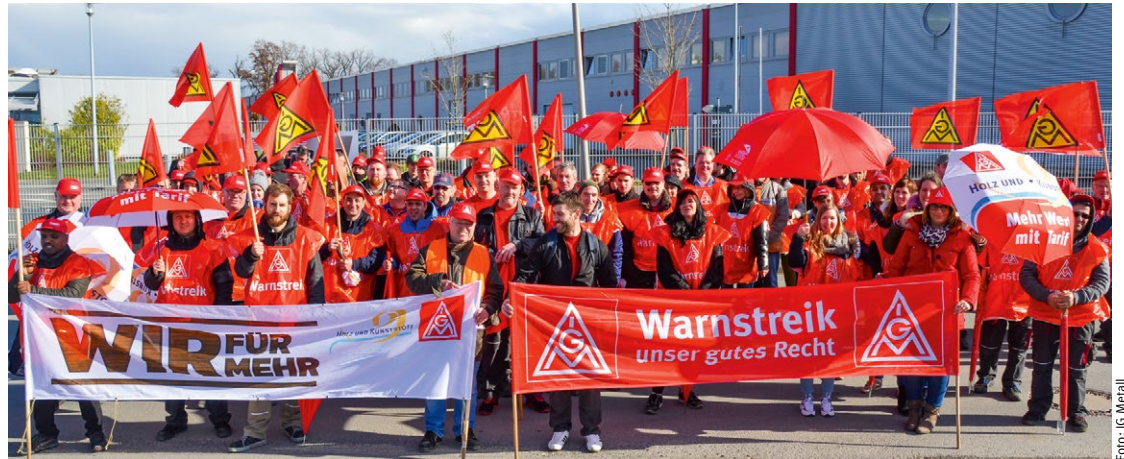
Warnstreik bei Express-Küchen

Die Wut der Kolleginnen und Kollegen bekamen die Arbeitgeber nach dem Verhandlungsabbruch am 9. März zu spüren: Mehr als 150 Beschäftigte der Früh- und