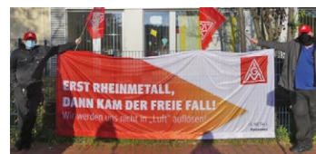
Protest vor dem Werkstor von KS HUAYU

Rheinmetall hat beschlossen, nur in Bereiche zu investieren, die hohen Gewinn bie-