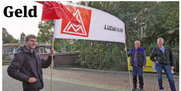
Archivfoto: mit Abstand in der Tarifrunde 2021 aktionsfähig.

Fischer: Rund 330 Beschäftigte arbeiten bei Lühr Filter. Der Altersdurchschnitt liegt bei 45,2 Jahren. Das wirkt sich jetzt schon aus. Der Betriebsrat informiert und betreut Kolleginnen und Kollegen, die in Altersteilzeit wollen. Wenn bald die Babyboomer-Jahre in Rente gehen, können wir den Fachkräftebedarf nicht mehr decken. Bereits heute sind nur noch zehn Auszubildende im Unternehmen. Auszubildende brauchen Ausbilder, die ihr gutes