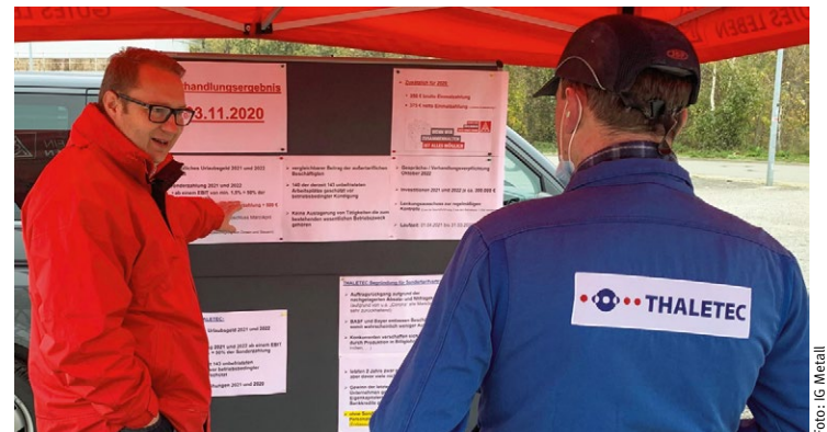
Mitgliederversammlung im Freien und in Kleinstgruppen.

Insolvenz abgewendet Bei KSM konnte sogar eine Beschäftigungssicherung für fünf Jahre sowie eine Investitionssumme im zweistelligen Millionenbereich abgeschlossen werden. Allerdings wollte der Arbeitgeber im Gegenzug Verzicht, um das insolvente Unternehmen wieder zu stabilisieren. Darüber hinaus konnte der chinesische Eigentümer letztlich davon überzeugt werden, zusätzliche fi-