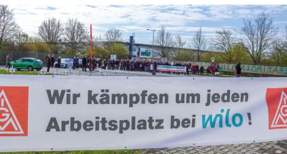
Beschäftigte vor dem Werkstor von Wilo in Oschersleben

ENDE MÄRZ 2022 IST SCHLUSS Wilo hat entschieden, seinen lukrativen Standort in Oschersleben zu schließen. Die IG Metall kritisiert das aufs Schärfste, da es weder technisch noch wirtschaftlich sinnvoll ist.