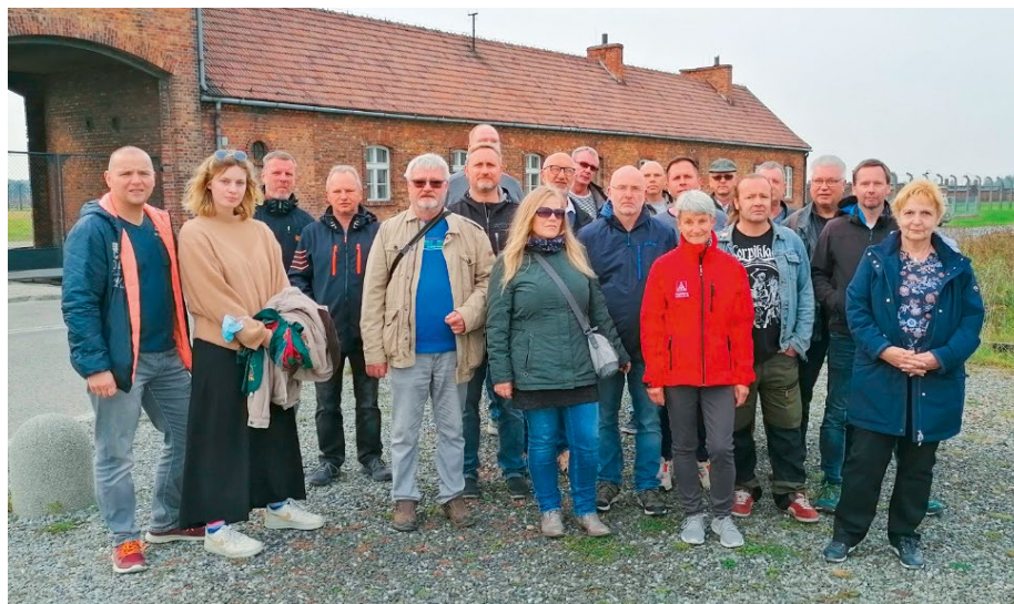
Teilnehmerinnen und Teilnehmer der Bildungsreise nach Auschwitz

Wir sind uns alle einig: Der Holocaust darf sich nicht wiederholen. Und deshalb ist es richtig und wichtig, sich mit der Geschichte auseinanderzusetzen und aus ihr zu lernen.