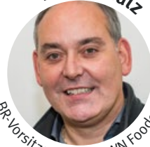
BR-Vorsitzender, CROWN Foodcan