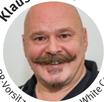
BR-Vorsitzender, Silgan White Cap