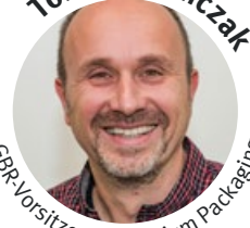
GBR-Vorsitzender, Trivium Packaging